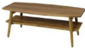
アポロ フォールディングテーブル