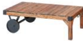
トロリーテーブル