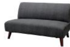
ロータイプソファ