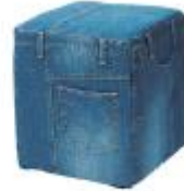
ジーンズスツール