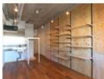
コンセプト空間 3 Rough

日常に“心地いい”を求める人へ。 有孔ボードの棚や床材、 壁紙など自然な素材感で和みスタイル。