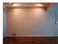
コンセプト空間 6 Wasabi

ロマンチックに“白”を愛でたい人へ。 白木の床から白い壁、コンクリオン白ベキの 高い天井へと白がつづく優雅な乙女スタイル。