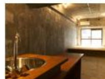
コンセプト空間 4 Doma

住空間にも“遊びゴコロ”が欲しい人へ。 DIYスペースで、釘打ちOK! ペイントOK! ラフな進化系スタイル。