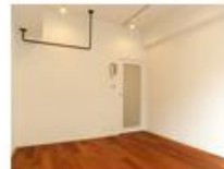
コンセプト空間 2 sozai

“カワイイ”をたいせつにする人へ。 ピンクと薔薇 (ローズ) と シャンデリアを大胆にあしらった姫スタイル。