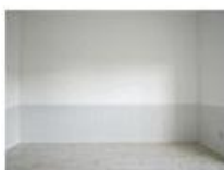
コンセプト空間 5 blanc

モダンに“和”を楽しみたい人へ。 土間と畳を組み合わせた 新しいつろぎスタイル。