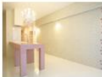
コンセプト空間 1 Rosa

“カワイイ”をたいせつにする人へ。 ピンクと薔薇 (ローズ) と シャンデリアを大胆にあしらった姫スタイル。